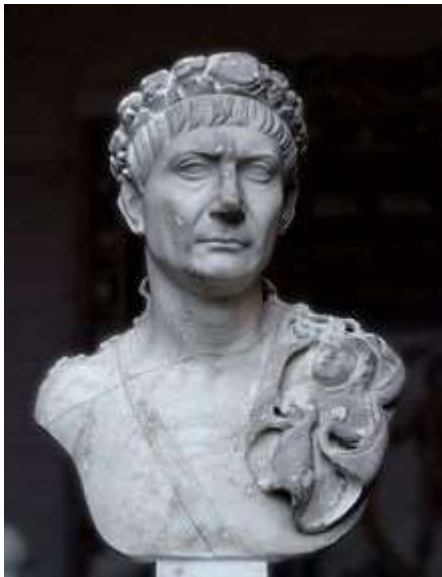
Buste de Trajan portant la couronne civique, une courroie d'épée et l'égide (attribut de Jupiter et symbole de la toute-puissance divine). Glyptothèque de Munich.