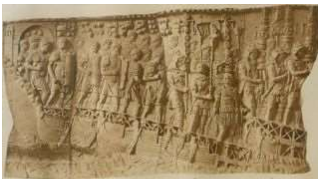
Les troupes romaines traversent le Danube sur un pont de bateaux. Bas-relief de la frise de la Colonne Trajane.

La colonne Trajane est la mère de toutes les colonnes historiées, celle de Rome, de Vienne et même de la place Vendôme à Paris